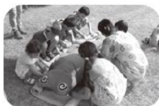
🐻 毛布で担架タイムトライアル