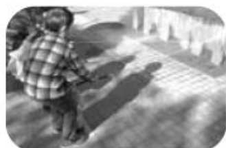
🐻 水消火器での的当てゲーム