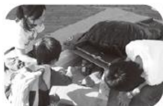
🐻 ジャッキアップゲーム