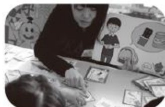
🐻 防災カードゲーム「なますの学校」

これらの防災体験プログラムに参加すると、おもちゃと交換できる「カエルポイント」がもらえるよ!